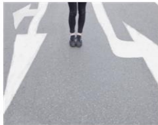
► Mein Fahrplan