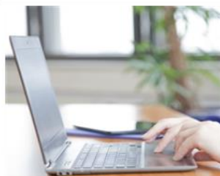
► Meine Bewerbung