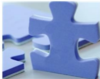
► Meine Talente