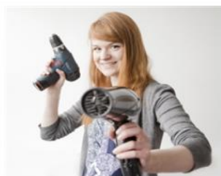
► Mein Beruf